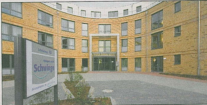
Der Wohnpark an der Schwinge ist eines von vielen Immobilienprojekten der AVW

(wd/nw). Im Stader Wohnpark an der Schwinge erinnert nichts an ein Pflegeheim: Die behagliche Atmosphäre, das erstklassige Ambiente und die freundlichen Mitarbeiter geben den Besuchern sofort ein Gefühl des Willkommenseins. Der Wohnpark wurde von der Buxtehuder Albrecht Vermögensverwaltung, der AVW Immobilien AG, geplant und gebaut und wird von der Agitalis AG aus Flensburg betrieben. Neben vier weiteren Einrichtungen gilt diese als eine der vielen Stader „Visitenkarten“ der AVW. Mehr Beispiele sieht man bereits, wenn man nur aus dem Fenster des Wohnparks schaut: Das Unternehmen hat das Ramada-Hotel, das Entertainmentcenter „Check In“ und das Arbeitsamt gebaut und das Gebäude des Gastronomiebetriebes „Die Scheune“ saniert. Auf der anderen Seite des Seniorenwohn-parks werden zur Zeit die abschließenden Arbeiten im „Was-